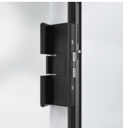
Seitlich integriertes Schließsystem Sistema di chiusura laterale integrata

Sia i profili sottili che l'inserimento del profilo dell'anta nel telaio fisso si traducono in un aumento della superficie della finestra. Così all'interno penetra più luce naturale, che non solo contribuisce a un migliore benessere psicofisico, ma sul lungo termine fa risparmiare energia.