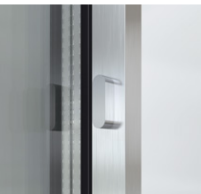
Zentral angebrachtes Schließsystem Sistema di chiusura nodo centrale

Il sistema scorrevole Schüco ASE 67 PD in alluminio comprende anche un sistema di chiusura completamente integrato nell'anta, disponibile in tre varianti - come chiusura integrata nel nodo centrale con o senza serratura o come chiusura tripla applicata a lato sull'anta per il telaio fisso. La combinazione di queste tipologie si traduce in un elemento antieffrazione di alto valore, e quindi in massima sicurezza e protezione.