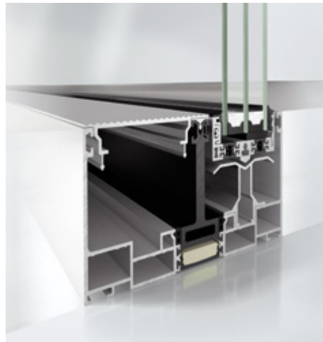
Abgesenktes Flügelprofil im 90-mm-Blendrahmen Profilo anta abbassato con telaio fisso da 90 mm